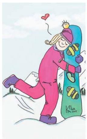
Рисунок Ольги Каплиной, УЭЛ-511

во всероссийском транспортном конкурсе «Трансп-Арт-2016» и успешно выступили на спартакиаде транспортных вузов, разделив второе и третье общекомандные места со сборной Самарского государственного университета путей сообщения.