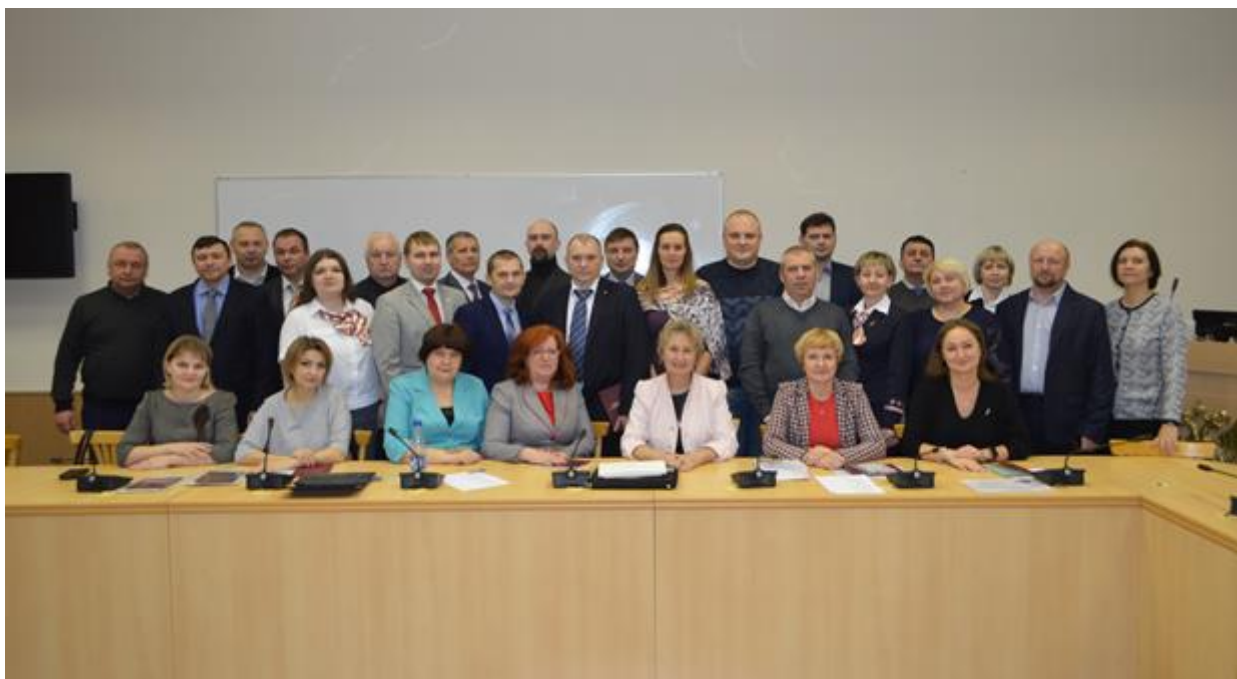
Вручение дипломов о профессиональной переподготовке преподавателям учебных центров ОАО «РЖД»

С полным перечнем программ дополнительного профессионального образования и условиями их реализации можно ознакомиться на сайте ЦВШПМ: http://miit.ru/portal/page/portal/miit/divs/hist?id_page=1960&id_pi_top=1265&id_pi_divs=1981&id_pi_hist=1982&id_pi_cpm=3&id_pi_mm=48&id_pi_mmc=64&id_pi_m2l=67&letter_divs=0&search_divs=0&curr_page_divs=1&curr_page_hist=1&curr_page_mmc=1&view_mode_top=1&idk_info_hist=1137&ct_mmc=2&view_mode_divs=2.0&d_division_divs=23057&id_division_hist=23057&ct_hist=3 .