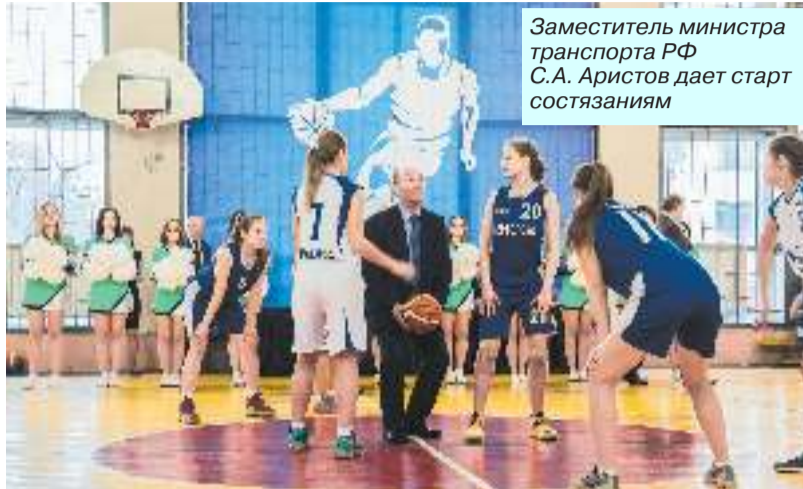
Заместитель министра транспорта РФ С.А. Аристов дает старт состязаниям

старт соревнованиям, посетив каждую из спортивных площадок.